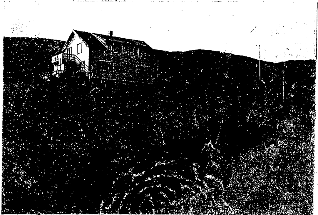
Slette-berg slik som det er no.